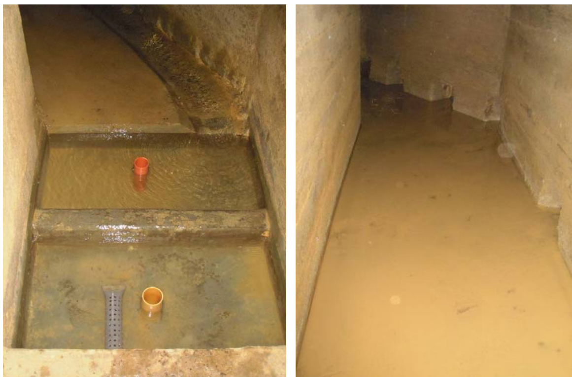
Vue intérieure du captage