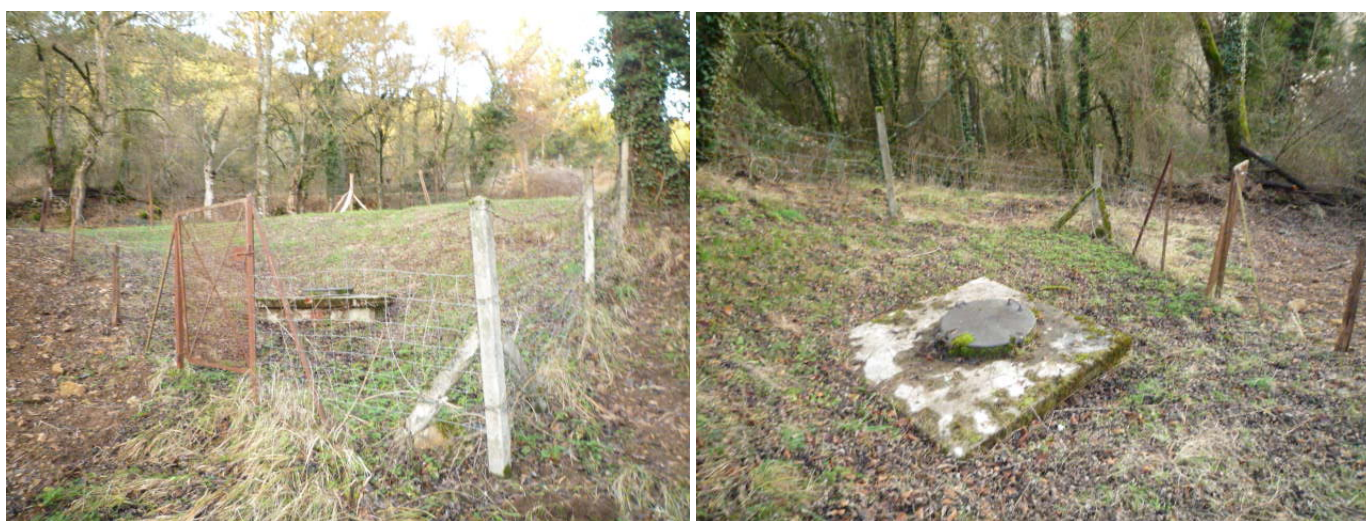
Vue extérieur du captage de Pomiers (périmètre clôturé et portillon)

Le périmètre est clôturé avec du fil barbelé sur des piquets bois et on y accède en ouvrant un portillon abîmé.